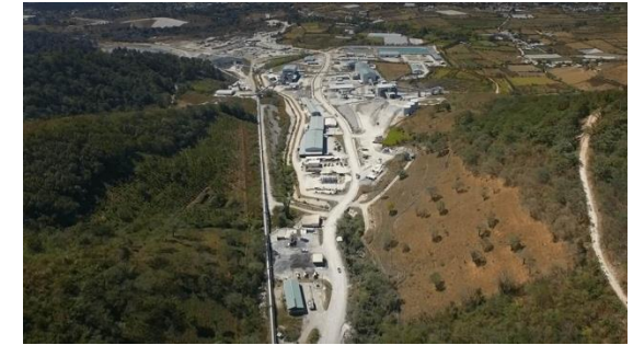
Mina El Escobal, Guatemala

Pueblo indígena Xinca despojado del territorio. Estigmatización, amenazas y asesinatos a personas defensoras de derechos humanos.