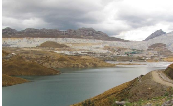
Lago Titicaca en Puno, Perú

En riesgo su cultura, modos de vida y patrimonio ecológico como el “Lago Titicaca”