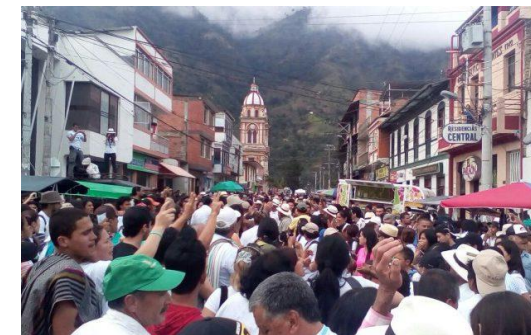
Consulta popular en Cajamarca, Tolima, Colombia

Regresión en derechos ciudadanos favoreciendo intereses de empresas transnacionales