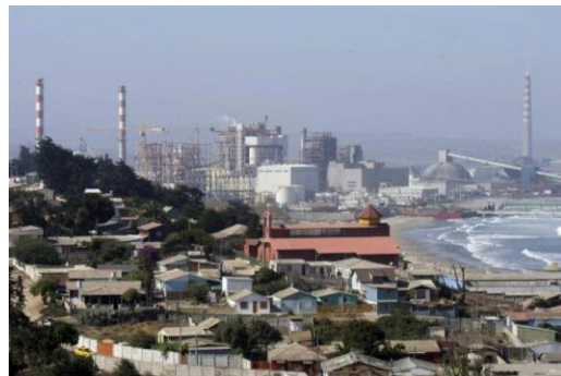
“Zona de sacrificio” Quintero y Puchuncaví, Chile

Afectación al derecho a la salud, la vida digna y a la autonomía territorial.