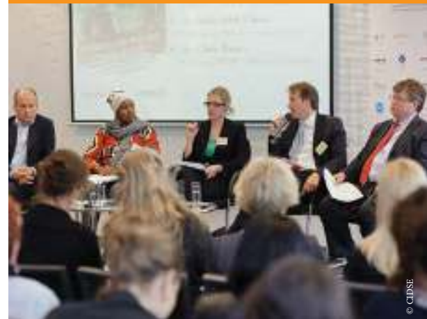
Ponentes en el debate de CIDSE, 8 de mayo de 2012

Los nuevos instrumentos de financiación de la CE tendrán implicaciones para las OSC en países en desarrollo y para la forma en la que los miembros de CIDSE trabajan con ellas. El Foro proporcionó una oportunidad propicia para revisar y debatir mecanismos de cooperación, con el fin de reforzar los asociaciones dentro de la familia de CIDSE y con las instituciones de la UE. Arrojó cierta luz sobre los cambios complejos en las relaciones de poder entre los Estados, los parlamentos, las autoridades locales, el sector privado y la sociedad civil en la cooperación al desarrollo. La UE ha desarrollado claramente una mayor comprensión política de la sociedad civil y sobre la forma en la que puede contribuir a conseguir los objetivos relativos a la gobernanza y a la rendición de cuentas. La cuestión ahora es ver cómo se van a traducir las intenciones de la UE en acciones concretas con un impacto positivo sobre el terreno y qué papel puede desempeñar nuestra red para que así sea.