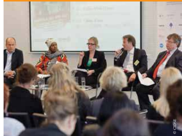
Panel d'intervenants au débat de la CIDSE, 8 mai 2012.

Les nouveaux instruments de financement de l'UE auront une incidence sur les OSC des pays en développement et sur la façon dont les membres de la CIDSE travaillent avec celles-ci. Le Forum était par conséquent l'occasion de passer en revue et de discuter des mécanismes de coopération afin de renforcer les partenariats au sein de la famille CIDSE et avec les institutions européennes. Il a mis en lumière l'évolution complexe des rapports de force entre États, parlements, autorités locales, secteur privé et société civile dans la sphère de la coopération au développement. L'UE appréhende manifestement la société civile d'une manière plus politique, en tenant compte de la façon dont celle-ci peut contribuer à la réalisation des objectifs de gouvernance et de redevabilité. Il reste à voir comment l'UE va traduire ses intentions en actions concrètes et positives sur le terrain, et le rôle que notre réseau peut jouer à cet égard.