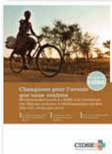
Changeons pour l'avenir que nous voulons Recommandations de la CIDSE à la Conférence des Nations unies sur le développement durable (Rio+20)