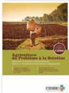
Agriculture: du problème à la solution – garantir le droit à l'alimentation dans un monde de contraintes climatiques Principes directeurs et recommandations

Depuis longtemps, la CIDSE publie des documents, des rapports et des déclarations politiques qu'apprécient aussi bien les décideurs, les stratèges politiques et les journalistes que celles et ceux qui font partie du réseau CIDSE ou de la sphère du développement. Ci-après, quelques-uns des principaux documents publiés en 2012: