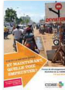
L'UE et la société civile: Et maintenant quelle voie emprunter? - Forum de développement Nord-Sud de la CIDSE Rapport de la conférence

Voyez le site www.cidse.org pour un aperçu complet des documents publiés en 2012, y compris les déclarations, recommandations et brochures.