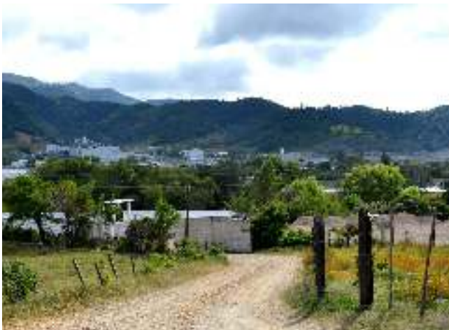
Entrada de la Empresa Minera San Rafael S.A.

y KCA (domiciliada en Vancouver, Canadá) están amenazando el disfrute de los derechos a la alimentación adecuada, al agua y a la tierra de las comunidades de La Puya. Por tanto, los EEUU y Canadá deben asumir sus obligaciones extraterritoriales de derechos humanos con relación a las actividades de dichas empresas, sometidas a su control regulador, en el caso de La Puya.