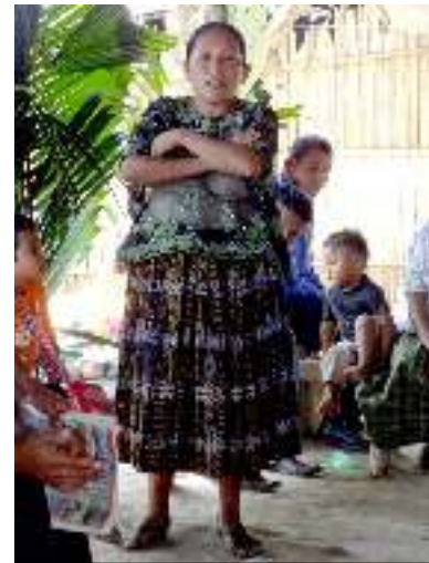
Agua Caliente, Panzós, Alta Verapaz. Lideresa de una comunidad desalojada comparte su testimonio.

Las familias desalojadas quedaron estigmatizadas en la región como “invasores de tierras” y sin reconocimiento legal alguno. Consideran que esto es una gran injusticia: “Nuestros abuelos ahí vivían y ahora nos califican como invasores” 115 . Viven situaciones de discriminación y exclusión en las escuelas y centros de salud. Por motivos económicos, de discriminación y distancia, hay altos niveles de deserción escolar. Las familias se enfrentan a grandes dificultades para encontrar trabajo, aunque sea temporal, y la mayoría sobrevive de la venta de chirivisco (zarzal seco) para leña o lavando ropa ajena.