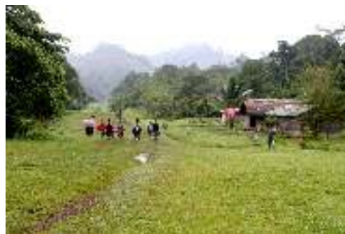
Foto: Eva Vanneste, entrada a la comunidad de Xalalá y pista de aterrizaje de avionetas.

El área de interés para el proyecto hidroeléctrico Xalalá está ubicada en la confluencia de los ríos Chixoy y Copón, que sirven de límite a los municipios de Ixcán y Uspantán, del departamento de Quiché, y al municipio de Cobán, del departamento de Alta Verapaz. El lugar es parte de la Franja Transversal del Norte (FTN), de interés estratégico por sus recursos naturales y para el cultivo de caña de azúcar y palma africana. Las familias maya q'eqchi viven en el área históricamente, han retornado, o han sido reasentadas tras el conflicto armado interno.