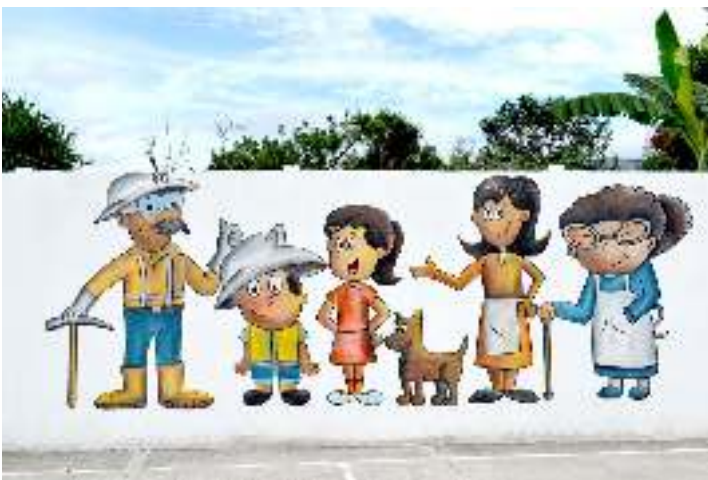
Escuela Pública Los Planes, San Rafael Las Flores, Guatemala (noviembre de 2014).

Varias mujeres denunciaron ante la Misión la presencia e influencia de la empresa en ciertas escuelas y en los programas sociales del Gobierno, condicionando a las y los alumnos a que acepten los regalos o las actividades de la empresa 87 . Una mujer mencionó haber recibido amenazas de una maestra: “o acepta o se los lleva de la escuela” 88 . En consecuencia, varias familias han decidido retirar a sus hijas e hijos de las escuelas para evitar dificultades o conflictos.