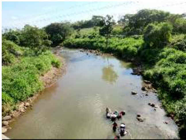
Desvío de ríos para beneficiar plantaciones de banano y palma africana en La Blanca-Ocós, San Marcos.

La SAA se comprometió a participar en una comisión interinstitucional para visitar la zona, pero indicando que las gobernaciones departamentales deberían convocarla. Asimismo, admitió que la falta de una Ley de Agua crea conflictividad y es un eslabón perdido en la nueva política agraria, la cual incluye las acciones para el cumplimiento de las Directrices sobre la Tenencia de la Tierra, la Pesca y los Bosques 130 .