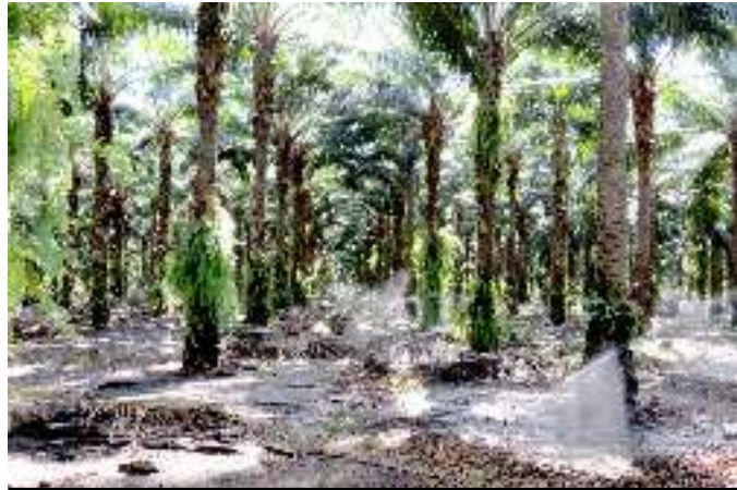
Riego de una plantación de palma africana en La Blanca/Ocós, San Marcos.

Además, la misma empresa ha iniciado trabajos de dragado en el río Pacayá sin consultar a la población de la zona, ni contar con autorización o un EIA, provocando conflictividad con y entre las comunidades. Para proteger sus plantaciones de palma africana la empresa construyó bordas y quíñeles, y con ello provocó el paulatino secamiento de lagunas, que son desfuegos naturales del río y lugares de provisión de agua para la producción de granos básicos.