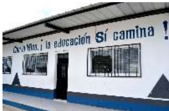
Escuela Pública Los Planes, San Rafael Las Flores, Guatemala (noviembre de 2014)

es la influencia de la empresa Minera San Rafael en la escuela pública de la aldea de Los Planes ( San Rafael Las Flores ): la empresa aprovechó su remodelación para promocionar sus actividades, entre otros, pintando dibujos y eslóganes favorables a la empresa en las paredes de la escuela. Varias madres denunciaron amenazas por parte de maestras a raíz de su oposición a las actividades o donaciones de la empresa; en algunos casos, se vieron obligadas a retirar a sus hijas o hijos de la escuela. Este