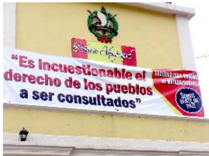
Foto: M. Alejandra Morena/FIAN Internacional. Municipalidad de Mataquescuintla, Jalapa (noviembre de 2014).

Además del impacto en la disponibilidad y calidad del agua, el proyecto también afectará a la biodiversidad. La contaminación, el acaparamiento y el cambio del uso de la tierra, así como el aumento en su precio, afectarán el acceso y control sobre la tierra y la situación económica de una buena parte de la población aledaña, que en su mayoría la utiliza para su subsistencia. La instalación de la