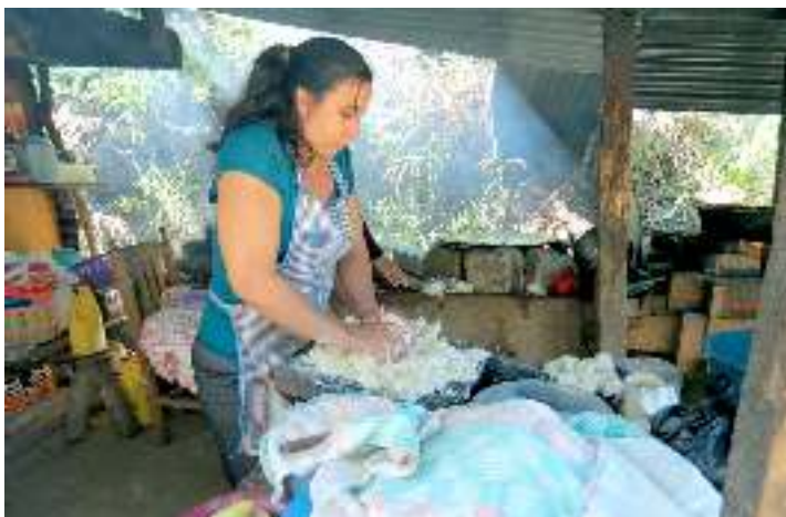
Foto: Giorgio Trucchi: Mujer preparando la masa de maíz para hacer tortillas y tamalitos, en el plantón de La Puya.

La minería de metales a cielo abierto en esta región es una amenaza grave a los DESC de la población local, ya que los procesos químicos necesarios para la extracción de minerales contribuirían a aumentar los ya altos niveles de contaminación del agua 60 , así como del suelo, afectando su productividad. Los pobladores mencionaron a la Misión: “Nosotros no nos oponemos al desarrollo, pero que se dé sin destruir nuestros medios de producción”. 61