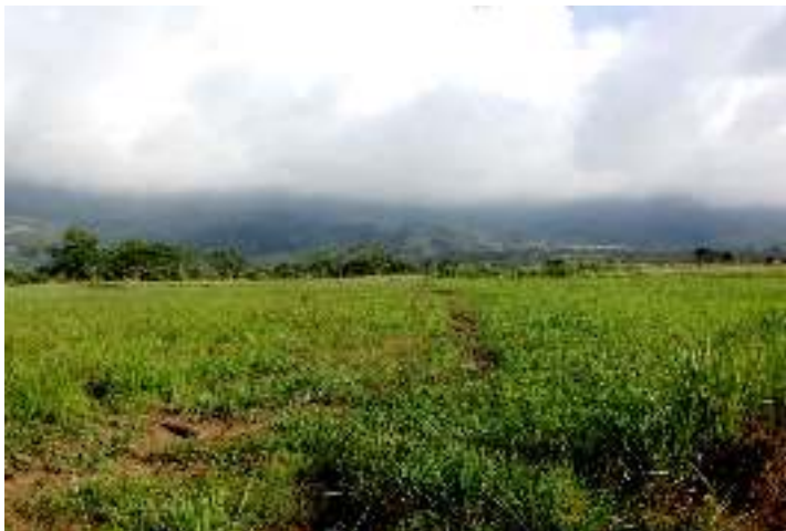
Las grandes extensiones del monocultivo de caña de azúcar en el Valle del Polochic.

En 2005 la empresa Chabil Utzaj se instaló en la región para promover la producción de caña de azúcar. El acelerado proceso de acaparamiento de tierras por parte de la familia Widmann, cuyo ingenio azucarero abarca 5,000 hectáreas 97 , se da en un contexto en el cual la hermana del dueño principal de la empresa era la esposa del entonces presidente Oscar Berger 98 . Esto podría explicar la acelerada regularización de estas tierras que estaban en