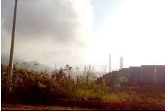
Las instalaciones de la Guatemala Niquel Company (GNC) en El Estor, Izabal.

para 140 familias, aunque en condiciones todavía precarias y se continúa la presión para que el Estado restituya a las 629 familias restantes 113 . Este proceso ha sido sumamente lento y costoso para los y las representantes de las familias que deben viajar frecuentemente a la capital para presionar al Gobierno.