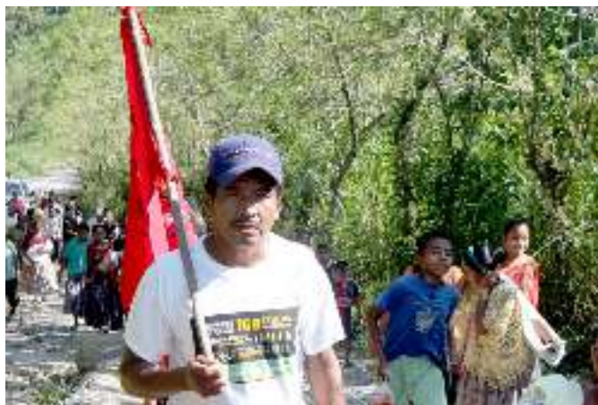
Foto: Alexis Williams. Población de San Valentín, Panzós, organiza una mini-marcha con la visita de la Misión, en conmemoración de la Marcha Indígena Campesina y Popular de 2012, para recordar del incumplimiento de las medidas cautelares incumplidas.

Según COPREDEH, el caso del Valle del Polochic “se considera una de las prioridades para el Gobierno” 121 . El Gobierno está buscando reubicar a las 4,000 personas de las 14 comunidades desalojadas. Según COPREDEH, como resultado de las medidas cautelares, el Estado ha repartido más de 22 millones de Quetzales en alimentos para las familias afectadas por los desalojos. Al cuestionar sobre el uso excesivo de la fuerza para desalojar a las comunidades en favor de las empresas, la COPREDEH reconoce