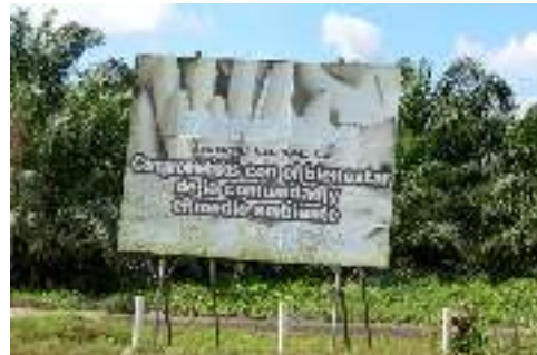
Finca Campo Verde propiedad de Bananera Nacional S.A. (BANASA), municipio La Blanca-Ocós, San Marcos.

Las 11 comunidades 125 afectadas, en su mayoría campesinas, son abastecidas directa o indirectamente por los ríos Ocosito y Pacayá. Residen en los municipios de La Blanca 126 (departamento de San Marcos), Coatepeque (departamento de Quetzaltenango) y Retalhuleu (departamento de Retalhuleu).