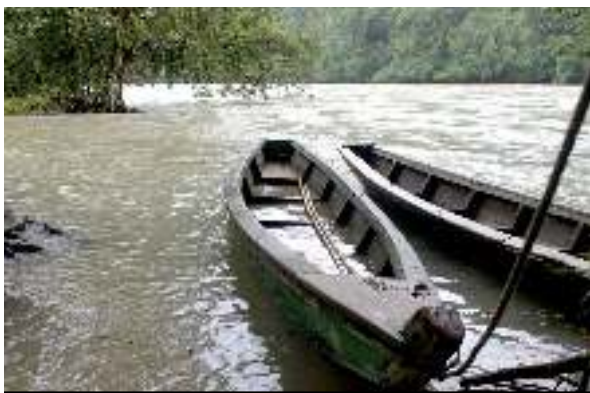
Foto: Almudena Abascal: Lancha sobre río Chixoy, entre el municipio de Ixcán, Quiché, y la región 5 de Cobán, Alta Verapaz. Sobre este río se planifica la construcción de la hidroeléctrica Xalalá.

En 2013, la Secretaría de Planificación y Programación de la Presidencia (SEGEPLAN) y el INDE elaboraron un Plan de Acción Inmediata (PAI) 141 y un Plan de Desarrollo Integral (PDI) para la subregión Xalalá 142 , que no surgen de las necesidades planteadas por las comunidades, ni por presión de las entidades de planificación del Estado, sino por interés y presión del INDE para acercar y generar confianza entre la población y el Estado.