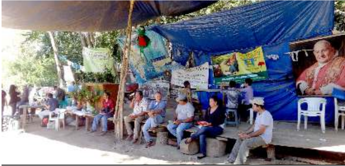
Foto: Giorgio Trucchi: Personas de la Resistencia de La Puya, en el plantón frente a la mina El Escobal.

En enero de 2012, las y los integrantes de la Resistencia tuvieron su primer acercamiento con el Estado, y sostuvieron reuniones con representantes del MEM, MARN, Ministerio de Salud Pública y Asistencia Social (MSPAS) y la Procuraduría de los Derechos Humanos (PDH), en las que plantearon el rechazo a todas las licencias mineras, mediante un memorial y adjuntaron copias de la evaluación independiente del EIA 63 . El Estado ignoró sus peticiones. Como protesta, el 2 de marzo del 2012, la Resistencia bloqueó con sus cuerpos la entrada a la mina para impedir de forma pacífica el ingreso de maquinaria, lo cual provocó una respuesta violenta por parte de empleados y seguridad de la mina.