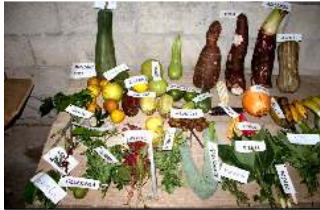
Foto: Alexis Williams. Diversidad alimentaria en Copalá, región 5 de Cobán, Alta Verapaz, área que sería afectada por la hidroeléctrica de Xalalá.

La Misión observó la diversidad de los alimentos que las familias producen en ejercicio de su soberanía alimentaria, y respetando a la madre tierra, en una región muy rica en biodiversidad 135 . El proyecto afectaría de manera directa a 13,968 personas de 58 comunidades, y de manera indirecta a 18,674 personas de otras 40 comunidades 136 . Varias comunidades quedarían sin acceso al agua y otras serían inundadas. Además, se afectaría su derecho a la